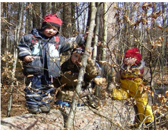
Spielend balancieren mit Freunden

Auskunft und Anmeldung zu einem Schnupper- vormittag: