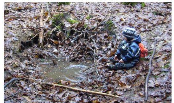
Angeln im Matschloch

Auskunft und Anmeldung zu einem Schnupper- vormittag: